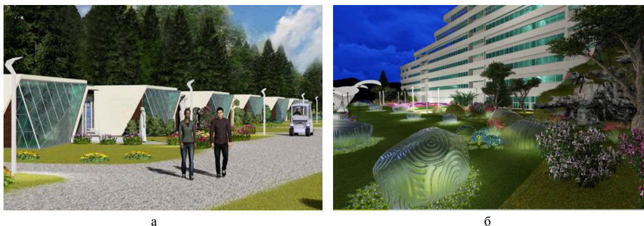
Рис. 2. Предметное наполнение зон «Парка народов мира», зона проживания гостей: а – индивидуальные домики; б – гостиница