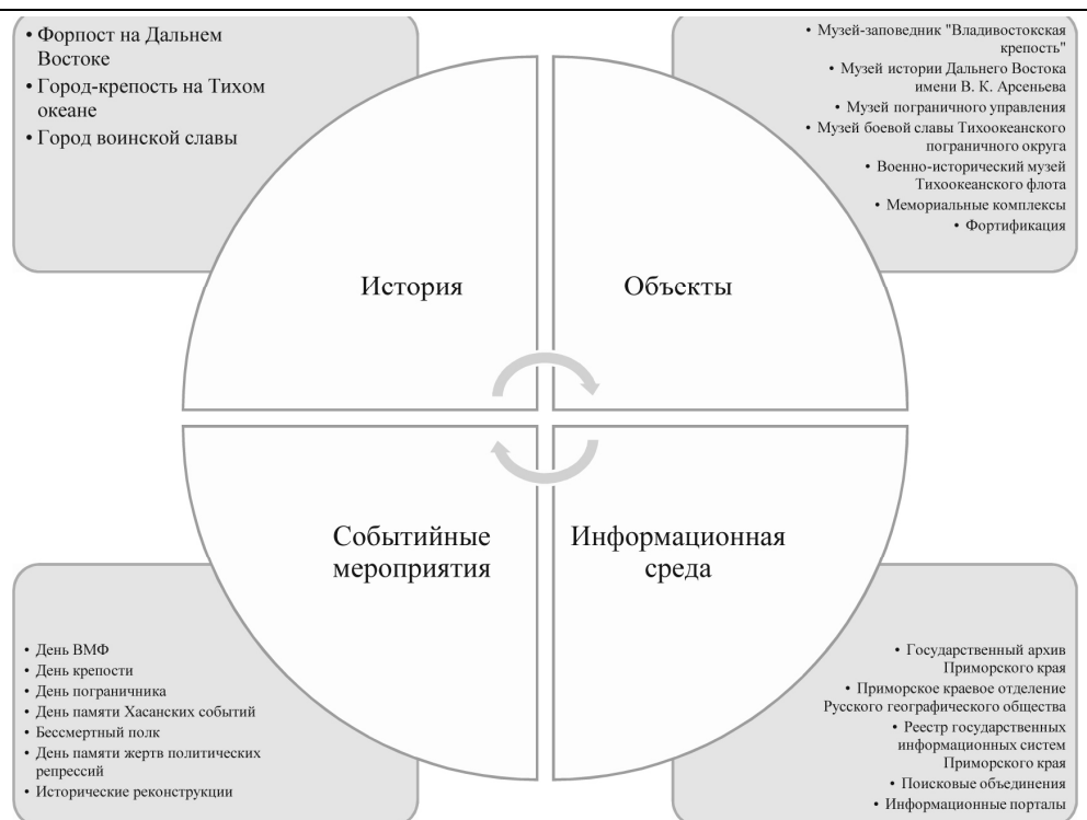
Рис. 3. Факторы развития военно-исторического туризма в Приморском крае

В результате из всех маршрутов Приморского края, перечисленных на сайте Туристско-информационного центра Приморского края, 23 маршрута (7,8 %) разделяют тему военного наследия [17]. Большая часть маршрутов проходит по территории Владивостока (14 маршрутов, или 61 %), остальные покрывают Хасанский, Шкотовский, Лазовский, Артемовский, Уссурийский, Находкинский и Партизанский районы.