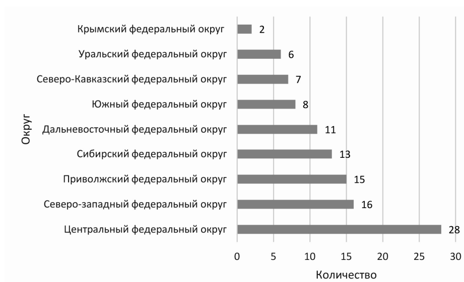
Рис. 2. Распределение военно-исторических маршрутов

С точки зрения предметно-пространственного окружения военно-исторического туризма необходимо отметить естественную неравномерность географического распределения ресурсов, зафиксированную, в частности, в атласе военно-исторических маршрутов, представленном в совместном проекте Российского военно-исторического общества и Федерального агентства по туризму (рис. 2) [14].