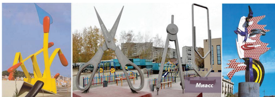
Рис. 4. Арт-объекты в городской среде с элементами куража

Сделать город интересным для туристов позволят и арт-объекты, вносящие кураж в городскую среду. Это позволит расслабиться в каменных джунглях бетонно-кирпичной городской среды, оживить окружающую человека среду и сформировать дополнительные запоминающиеся образы применительно к архитектурной среде (рис. 4). Включение подобных арт-объектов в городскую среду должно быть весьма дозированным, чтобы не умалить и не упростить архитектурную целостность города.