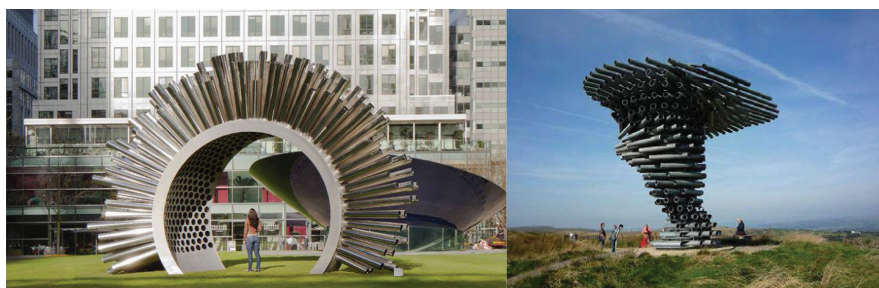
Рис. 5. «Эолова арфа» и «поющее дерево» в Барселоне и Британии

Конкретно для Владивостока с его сильными ветрами весьма привлекательным было бы создание звуковых арт-объектов по примеру уже встречающихся в мировой практике поющих композиций. «Поющее дерево» в Барселоне и интерактивный павильон в Британии, который носит название «Эолова арфа», неизменно вызывают интерес, создавая запоминающийся объект определённого места. Арт-объекты используют в местах, где имеют место постоянно дующие ветра. Через трубы, из которых созданы эти арт-объекты, проходит ветер, создавая при этом необычный «поющий» звук (рис. 5).