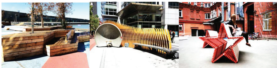
Рис. 3. Места группового размещения в городской среде

Сделать город интересным для туристов позволят и арт-объекты, вносящие кураж в городскую среду. Это позволит расслабиться в каменных джунглях бетонно-кирпичной городской среды, оживить окружающую человека среду и сформировать дополнительные запоминающиеся образы применительно к архитектурной среде (рис. 4). Включение подобных арт-объектов в городскую среду должно быть весьма дозированным, чтобы не умалить и не упростить архитектурную целостность города.