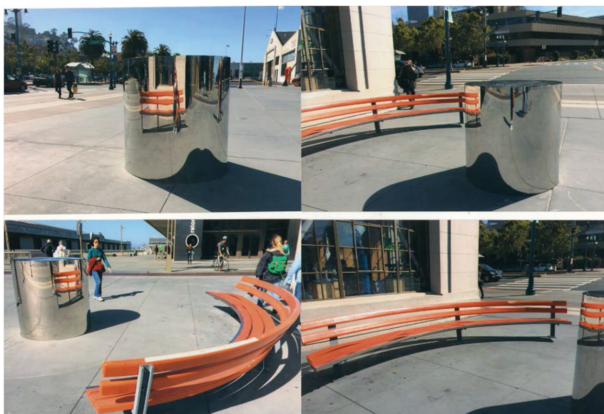
Рис. 6. Скамья в Сан-Франциско с развлекательным элементом

Арт-объекты могут исполнять художественную функцию, функциональную, развлекательную и даже образовательную. Пример, в Сан-Франциско городская скамья в качестве дополнения имеет форму с отражательной поверхностью, превращая использование скамьи в развлекательный аттракцион (рис. 6).