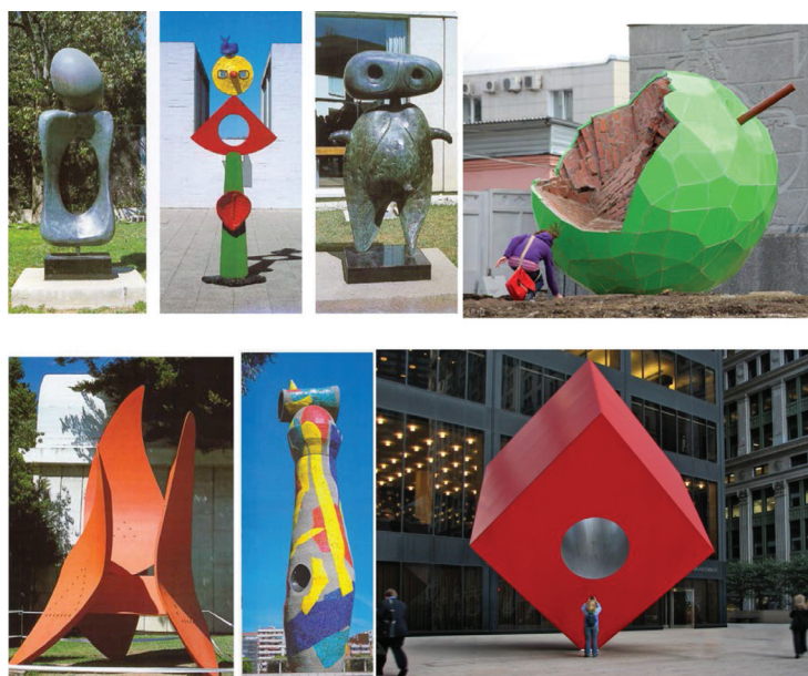
Рис. 2. Примеры точечных арт-объектов в городской среде

Красивые и необычные формы эстетически обогащают сложившуюся городскую среду, делают её привлекательнее, современной и комфортней. Мировой опыт городского благоустройства даёт нескончаемые примеры таких арт-объектов (рис. 2). Размещаясь в различных точках города, они позволяют достаточно легко ориентироваться в городской среде, создают систему навигации в городе. Видовые площадки города целесообразно оборудовать комплексными формами, включающими места для сидения, причём предполагающие более свободную форму размещения, с интересными в композиционном отношении акцентными формами, представляющими как бы «места общения». Красивые и необычные формы, удобные и эстетически комфортные человеческому взгляду, становятся замечательным моментом в организации концентрированного размещения не только группы туристов, но и многочисленной компании из коренных горожан (рис. 3). «Обеспечение комфортности среды для человека не может идти без рассмотрения аспекта видеоэкологии, акцентирующей необходимость гармоничного взаимодействия архитектурных объектов с открытыми пространствами вокруг них» [3].