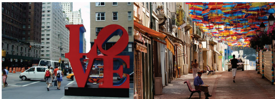
Небесные зонтики, Португалия

Представляют интерес и арт-объекты событийного назначения: прозрачные, конструктивно-устойчивые структуры, в плоскостях которых появляется цветное заполнение, позволят быстро расцветить город к какому-либо событию (рис. 7). Также украшают город и сезонные арт-объекты, цель которых привлечь горожан к активному облагораживанию городской среды. Подобные объекты не только поднимают настроение и создают ощущение яркого праздника, но и привлекают внимание.