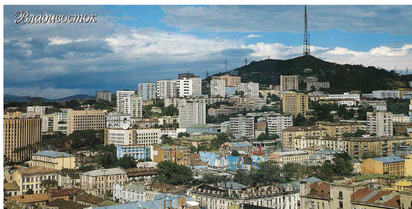
Рис. 1. Вид на город Владивосток

Однако в последнее время у города формируется важная функция – функция российского центра международного сотрудничества на Тихом океане, во многом определяющая его новый общероссийский и международный образ. «Для эффективного выполнения таких масштабных функций город должен иметь значительный собственный потенциал: экономический, демографический, инфраструктурный, культурный, научно-технический, военный – именно в активном наращивании этого потенциала, формировании здесь крупного центра международного сотрудничества и должен заключаться новый этап развития Владивостока» [1]. «Учитывая уникальное географическое положение города и края, в числе приоритетных отраслей должен быть и въездной международный туризм» [Там же. С. 6].