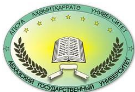
Абхазский Государственный университет (Республика Абхазия, г. Сухум)