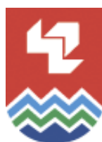
Институт экономики —Карельский научный центр РАН (Россия, г. Петрозаводск)