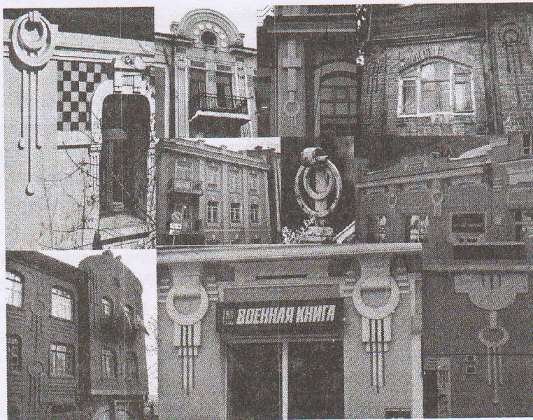
Рис. 1. Архитектурная деталь «кольцо в кольце»

вания, обмеров с последующей светотеневой моделировкой в технике отмывки сухой китайской тушью (рис. 2).