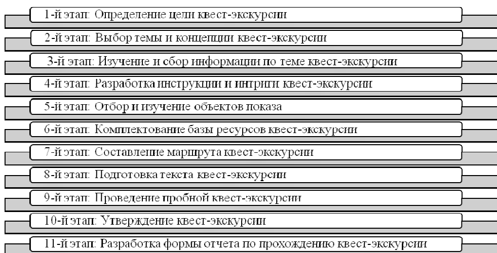
Рис. 3. Алгоритм создания квест-экскурсии

Алгоритмы создания квеста и экскурсии имеют схожие этапы, которые могут быть использованы в другой последовательности. На основании материалов об организации экскурсионной деятельности и работы квестов можно предложить следующую схему формирования квест-экскурсии (рис. 3).