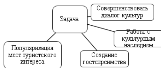
Рисунок 1 – Прямые задачи добровольцев

Нужно отметить, что в контексте привлечения активистов в рамках данного проекта финансовый фактор – не главный. В действительности, минимизировать траты при реализации подобных проектов достаточно сложно, а избежать их полностью не представляется возможным.