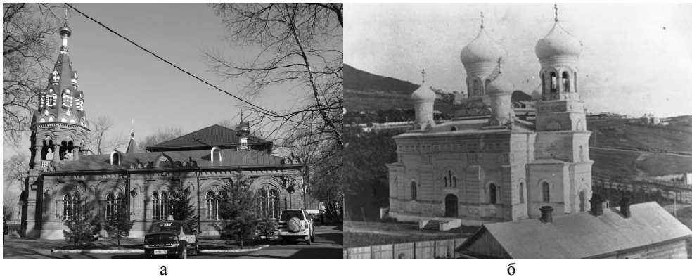
Рис. 4. а) Архиерейское подворье на Седанке, архитектор И.В. Мешков, 1901 г.; б) Покровская церковь, 1902 г.

сточные исследователи [11]. Функциональное зонирование планов явно выполнено с учетом столичного и транссибирского опыта проектирования железнодорожных вокзалов как крупных общественных сооружений.