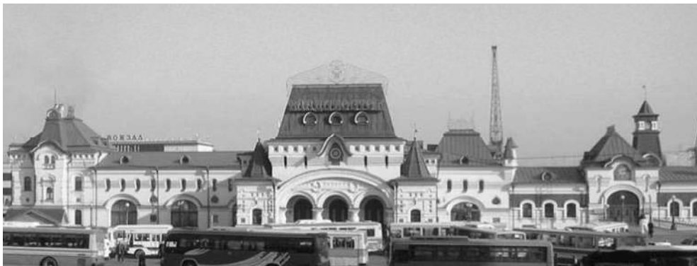
Рис. 5. Вокзал, Владивосток, 1912 г.

Вокзал Владивостока можно отнести к переходному варианту от русского стиля к неорусскому варианту романтического модерна, так как он обладает чертами и того и другого. Несмотря на сходство с Ярославским вокзалом, обращенным к архитектуре Русского Севера, в которой, как в «сокровищнице народной культуры», находит свои истоки неорусский стиль, Владивостокский вокзал остается в рамках образной системы русского узора XVI–XVII веков, идеала централизованной самодержавной власти. В сравнении с Ярославским вокзалом он решен более дробно и перегружен декором. Но в то же время в его архитектуре присутствуют черты модерна: крупные членения фасада и входной части, большие витражные окна, легкость комбинирования четких объемов, сочетание симметричных и ассиметричных композиционных приемов.