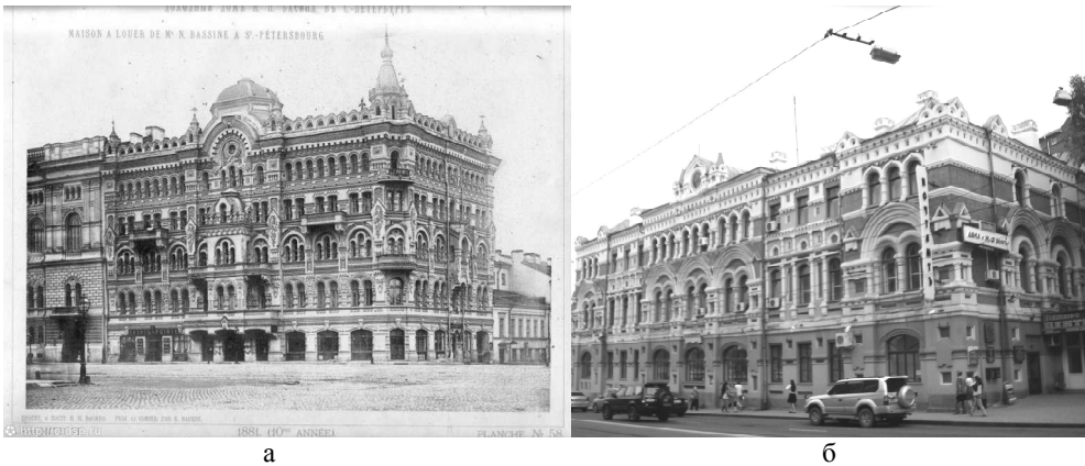
Рис. 3. а) собственный доходный дом Н.П. Басина, Санкт-Петербург, 1879 г; б) Почтово-телеграфная контора, архитектор А.А. Гвоздзиовский, 1899 г.

Русский же стиль, к которому относятся и Покровская церковь Владивостока (рис. 4б), и Архиерейское подворье (рис. 4а), продолжает экспериментировать с допетровскими формами. Подворье, выстроенное по проекту военного инженера И.В. Мешкова в 1901 г., представляет композицию из трех геометрически правильных объемов: дома с молельней, колокольни и храма-часовни Александра Невского.