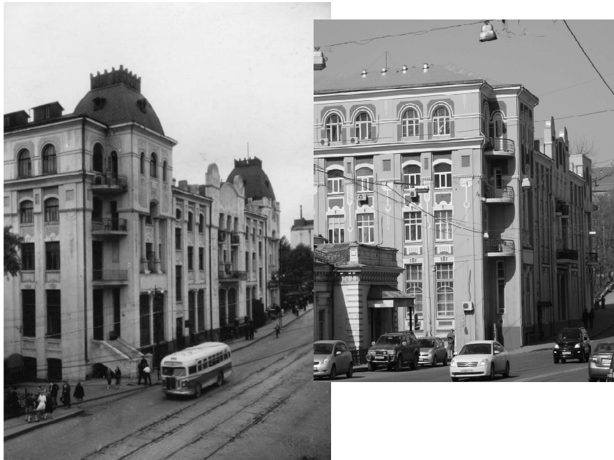
Рис. 6. Образ Светлого Города заложен в архитектурное решение бывшего доходного дома по Светланской, 50, здание Президиума ДВО РАН (1912–1914 гг.)

Этот же образ Светлого Города заложен в архитектурное решение бывшего доходного дома по Светланской, 50 (рис. 6), ныне здания Президиума ДВО РАН. «Как «государственный» заказ, так и демократические поиски воплощения «народности» в архитектуре, подчас оппозиционные власти, способствовали обращению к историческим ассоциациям» [5]. Романтический модерн, провозвестником которого стала Абрамцевская церковь, в своем романтическом варианте тоже обращается к национальной архитектуре, но отлично от эклектики: «работая с «исторической» формой и сохраняя в целом ее узнаваемость, архитектор видоизменяет ее очертания и пропорции, усиливая, как правило, звучание характерного признака» [3].