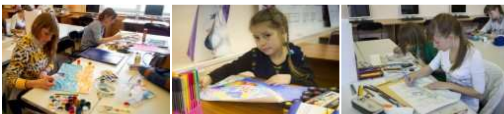
Рис. 5. Второй этап. Работа конкурсантов в аудитории

Параллельно с аудиторной работой участников конкурса, сопровождающие их педагоги и родители принимают участие в творческих на мастер-классах, организованных преподавателями кафедры дизайна и технологий.