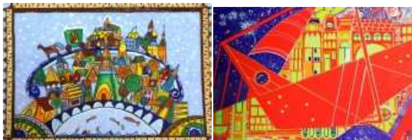
Рис. 3. Работы учащихся возрастной группы 11 – 13 лет

Второй этап приурочен к весенним школьным каникулам. Мероприятие проходит два дня в университете на кафедре ДЗТ: в первый день, участники по возрастным группам размещаются в аудитории и, в течении трех часов работают над предложенной оргкомитетом темой. Задания озвучиваются непосредственно в аудитории перед началом работы.