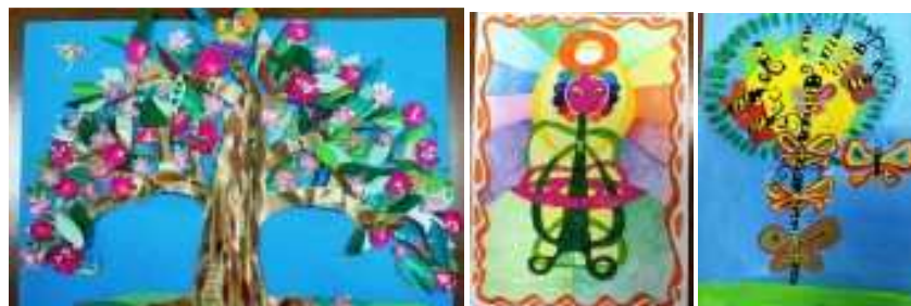
Рис. 2. Работы учащихся возрастной группы 8 – 10 лет

Ежегодно, на отборочный, заочный этап конкурса присылают работы до тысячи юных художников. Все работы интересны и своеобразны, но конкурс есть конкурс, и обязательно должны быть победители. Поэтому, во втором, очном, этапе принимают участие порядка трехсот человек.