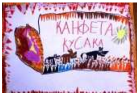
Рис. 6. Работа на тему «Фантик для конфеты» завоевала приз зрительских симпатий на страницах социальных интернет ресурсов.

По сложившейся традиции, награждение проходит на следующий день после конкурса в торжественной обстановке зала «Андеграунд» и сопровождается театрализованным представлением, подготовленным «Театром мод» ВГУЭС.