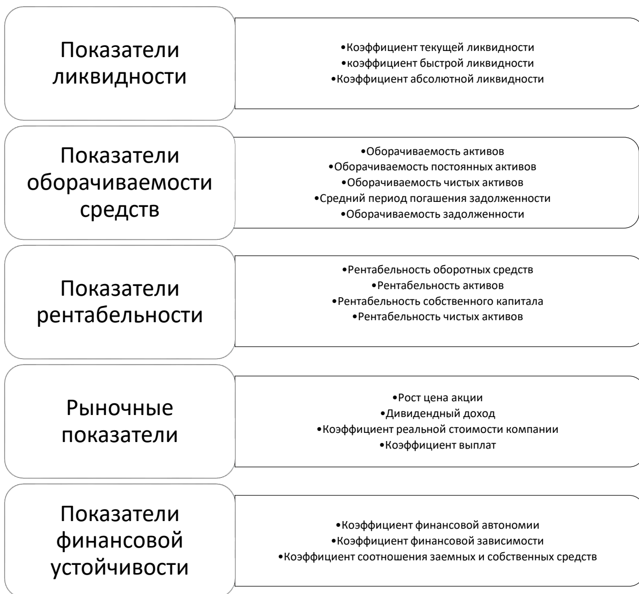
Рисунок 2 – Группа показателей, используемых в рамках финансового анализа исходя из информации бухгалтерской отчетности [2].

Одними из наиболее важных показателей финансового анализа предприятия являются коэффициенты рентабельности/прибыльности производства и бизнеса. По факту, финансовый результат – это главная мотивация собственников компании. Таким образом, формирование рентабельности и прибыли – это задача управляющих, стоящая в рамках операционной и стратегической деятельности.