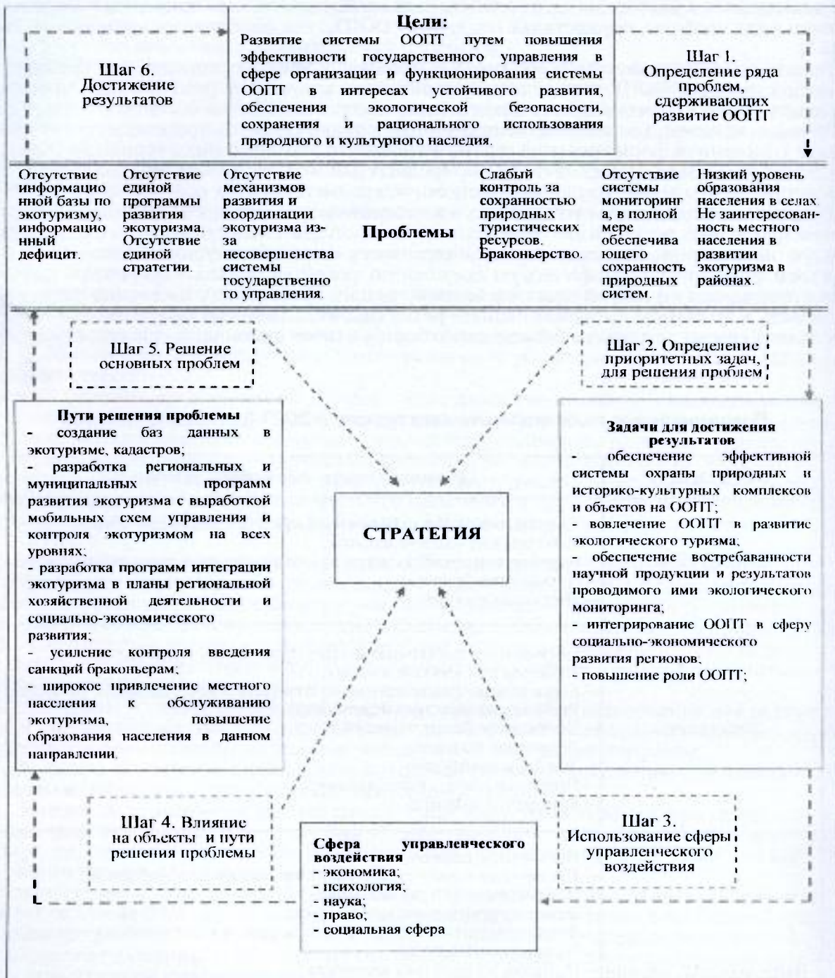
Рис.1. Механизм формирования стратегии развития экологического туризма в ООПТ (составлено автором)

Безусловно, это работа ни одного дня, но учитывая, что особо охраняемые природные территории приковывают к себе внимание со стороны властей, общества и бизнеса, решить эту непростую задачу можно всем сообща, благодаря развитию экологического туризма. Неслучайно, глобальное значение экотуризма состоит в том, что именно он способствует охране редких и исчезающих экосистем, являющихся резерватами биоразнообразия в регионах и на Земле, обеспечивает пути устойчивого развития. Благодаря экотуризму происходит тесное взаимодействие с различными сферами деятельности в регионе, важными для его неистощимого развития. Экотуризм в регионе активизирует многие другие виды деятельности и другие производства. На сегодняшний день на экотуризм приходится около 10% мирового валового продукта, мировых инвестиций и всех рабочих мест. Россия пока что в этом виде деятельности