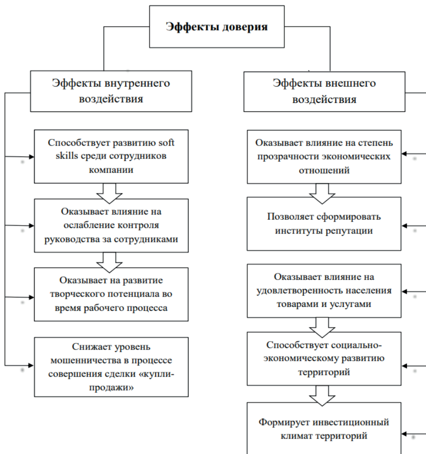
Рисунок 2. Эффекты доверия в развитии экономики