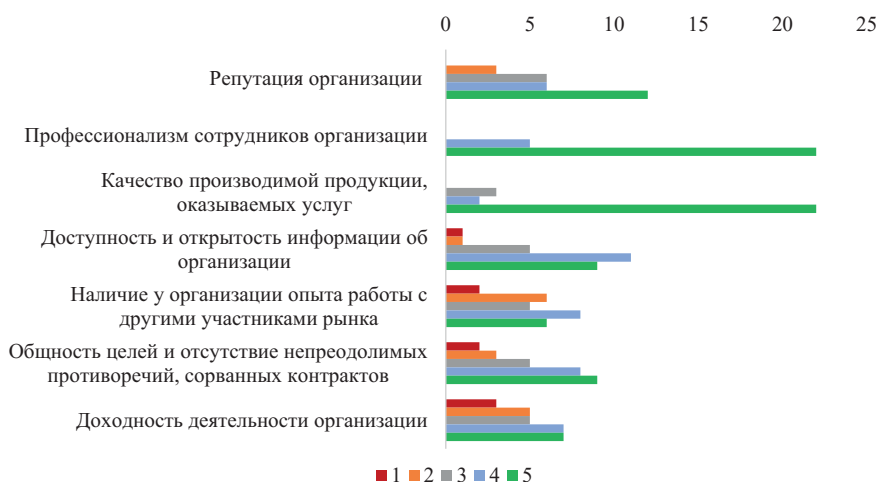
Рисунок 3. Оценка важности критериев формирования межфирменного доверия

Опрос предполагал оценку каждого критерия по шкале от «1» до «5», где 1 – «совсем не влияет», а 5 – «очень сильно влияет».