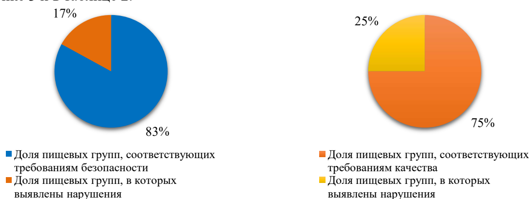
Рисунок 2 – Доля пищевой продукции, в которой выявлены нарушения требований безопасности (по группам), %

Далее были проанализированы нарушения в области качества, данные представлены на рисунке 3 и в таблице 2.