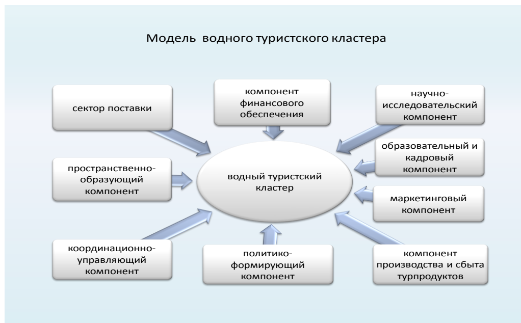
Рис. 1. Основные компоненты, формирующие водный туристский кластер Разработано автором по [6]

Итогом такого взаимодействия является формирование эффективного туристско-рекреационного комплекса, инновационный рост в индустрии туризма, повышение эффективности бизнеса и туристского интереса на основе эффекта синергии государственно-частного партнерства.