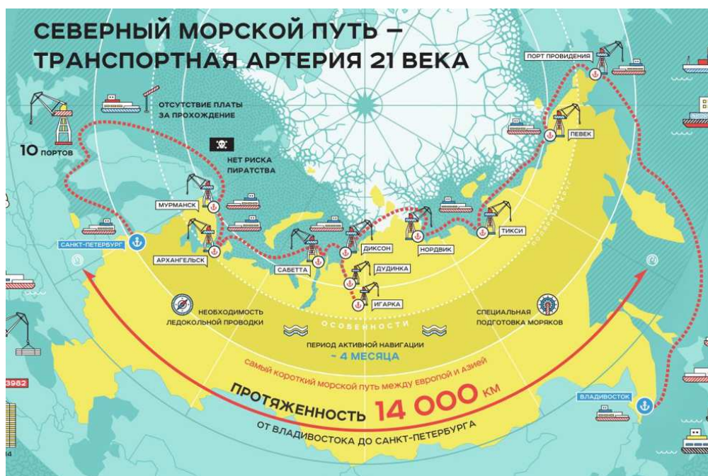
Рис. 1. Северный морской путь на карте

Формируемая на Дальнем Востоке России система МТК включает в себя Северный морской путь в рамках Северного морского транзитного коридора. По административным данным, протяженность СМП считается от Карских Ворот до бух. Провидения; составляет 5600 км. Однако исторически СМП всегда рассматривали и развивали как единую транспортную коммуникацию по Северному Ледовитому океану от северных портов Мурманск и Архангельск до порта Владивосток (рис. 1). Поэтому сейчас в правительстве обсуждается концепция Большого Северного морского пути под названием «Северный морской транзитный коридор» или «Трансарктический транзитный коридор», который начинается в Санкт-Петербурге и заканчивается во Владивостоке. Его протяженность составит 14 280 км.