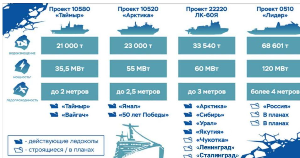
Рис. 4. Атомный ледокольный флот России

По состоянию на 2025 г. в составе ледокольного флота РФ 42 ледокола: 34 дизель-электрических и восемь атомных ледоколов (из них четыре – нового проекта 22220). Новый ледокол – «Якутия» – вошел в состав флота в марте 2025 г. Заложены еще три ледокола: «Чукотка» и «Ленинград» проекта 22220, а также атомный головной ледокол «Россия» проекта «Лидер».