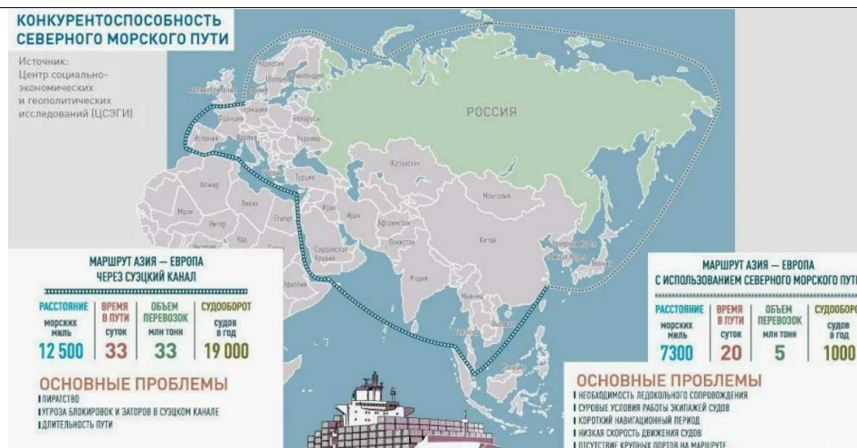
Рис. 3. Северный морской путь и Южный морской путь на карте

Экономическая выгода также очевидна. Проход через Суэцкий канал обходится судовладельцам в 300–700 тыс. долл. США за рейс в зависимости от тоннажа. На СМП отсутствуют аналогичные транзитные платежи: затраты сводятся к портовым сборам и услугам ледоколов, что в совокупности делает арктический маршрут более привлекательным.