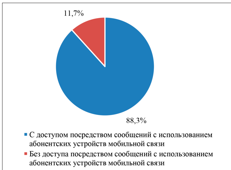
Рис. 3. Доля счетов физических лиц с доступом в ДБО посредством сообщений с использованием абонентских устройств мобильной связи в Приморском крае на 01.01.2024 г. [6]