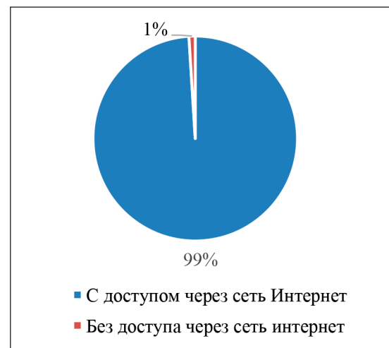
Рис. 2. Доля счетов физических лиц с дистанционным доступом в Приморском крае на 01.01.2024 г. [6]

Следует отметить, что большая часть всё-таки имеет доступ в ДБО, в веке цифровых технологий почти у каждого второго есть смартфон с выходом в интернет.