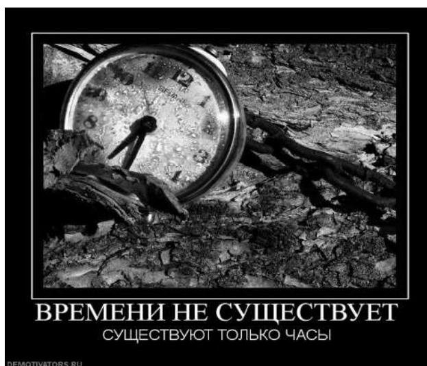
Рис. 1. Интернет-демотиватор философской тематики

К демотиваторам философской тематики мы относим демотиваторы, которые посвящены размышлениям автора о смысле жизни, любви, дружбе, предательстве, смерти, правде, лжи, судьбе и т.д.