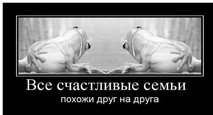
Рис. 2. Интернет-демотиватор философской тематики с комическим эффектом

Важным аспектом анализа интернет-демотиватора философской тематики является его содержательное наполнение и связанные с этим механизмы воздействия на адресата. В ходе анализа нами было установлено, что все демотиваторы философской тематики можно разделить на 2 группы с точки зрения содержания и связанной с ним эмоционально-экспрессивной составляющей. Это демотиваторы с комическим эффектом и без него. Демотиваторы философской тематики с комическим эффектом – это демотиваторы, которые могут быть смешными, причём выявляется комический эффект при соотнесении вербального компонента и иконического.