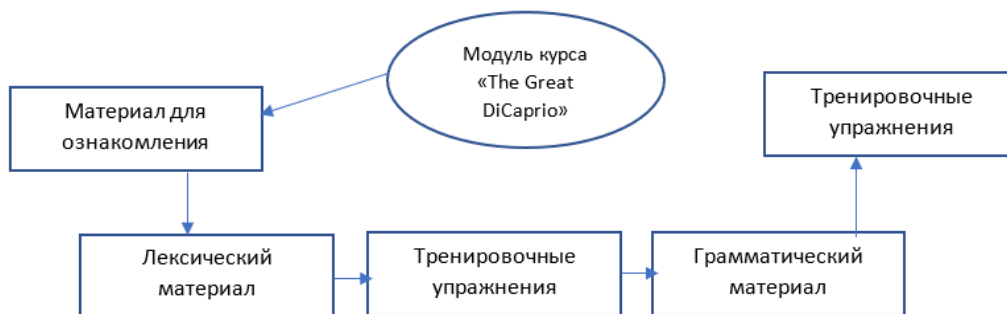
Рис. 2. Структура типичного модуля курса «The Great DiCaprio»

«The Great DiCaprio» – второй из разработанных нами электронных учебных курсов. Основной задачей данного курса является развитие навыков разговорного английского языка. Уровень владения английским языком обучающихся – Intermediate. Материалы курса размещены на платформах Stepik и Eduardo. Курс посвящен жизни и творчеству американского актера Леонардо ДиКаприо. Структура и содержание курса «The Great DiCaprio» представлены на рис. 2 и в табл. 2.