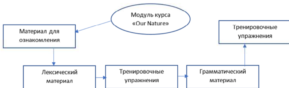
Рис. 1. Структура типичного модуля курса «Our Nature»