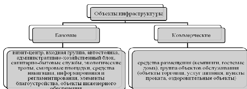
Рис. 1. Объекты инфраструктуры на ООПТ

Объекты инфраструктуры на ООПТ подразделяются на базовые и коммерческие (рис. 1) [15].