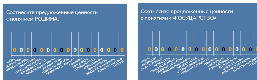
Рис. 3. Скриншот экрана. Вопрос 3

Этап 5. Проведение опроса группы студентов для выявления и соотнесения ценностных установок с понятиями «РОДИНА», «ГОСУДАРСТВО» с помощью российского конструктора интерактивных презентаций, онлайн опросов и тестов Unislide. Студентам было предложено соотнести указанные выше российские ценности с понятиями «РОДИНА» и «ГОСУДАРСТВО» (см. рисунок 3).