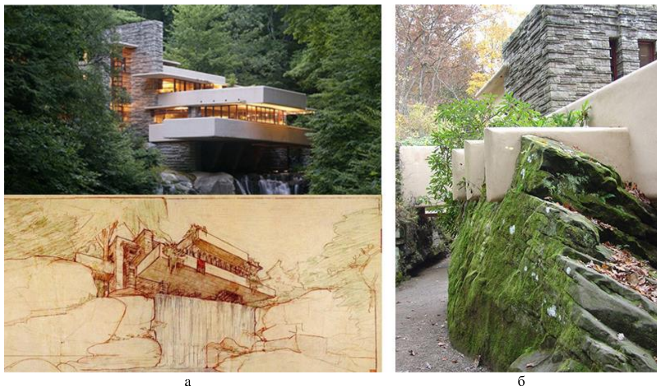
Рис. 3. «Дом над водопадом», арх. Фрэнк Ллойд Райт, Штат Пенсильвания, США, 1939 г. [5]: а) общий вид; б) северный фасад

словно вырос из утеса (часть скалы вошла в пространство дома и стала элементом интерьера). Дом вписался в мир валунов и деревьев так, будто когда-то сам вырос на этой скале – странноватый, но вполне естественный гриб, полип, окруженный нетронутыми деревьями и огромными камнями. «Дом над водопадом» построен из любимых материалов Райта – бетона и естественного камня. В нем четыре этажа, но благодаря множеству открытых террас кажется, что уровней больше. Интерьер дома также впускает в себя тему фактурного камня и пластичного бетона, однако помещения не смотрятся темными каменными пещерами за счет широкого, панорамного остекления. Помещения в доме достаточно традиционны: большое единое жилое пространство и четыре просторных спальни. Но комнаты имеют второстепенное значение по сравнению со сложным многослойным организмом бетонных террас и камней, удерживающих их. Иногда комнаты вырезаны в камнях, иногда они представляют собой участки террасы, огороженные стеклянными стенами в стальных каркасах. Элементы здания затейливы, но без особых излишеств, поскольку они соответствуют общему замыслу: лестничный пролёт спускается из проёма в полу гостиной и парит непосредственно над поверхностью ручья; три ствола деревьев прорастают прямо в полу западной террасы; несрезанный валун выступает из выложенного камнями пола подобно скале, на которой был заложен дом. Этот последний штрих был предложен Э. Кауфманом – владельцем дома, и тотчас же всецело одобрен архитектором [4].