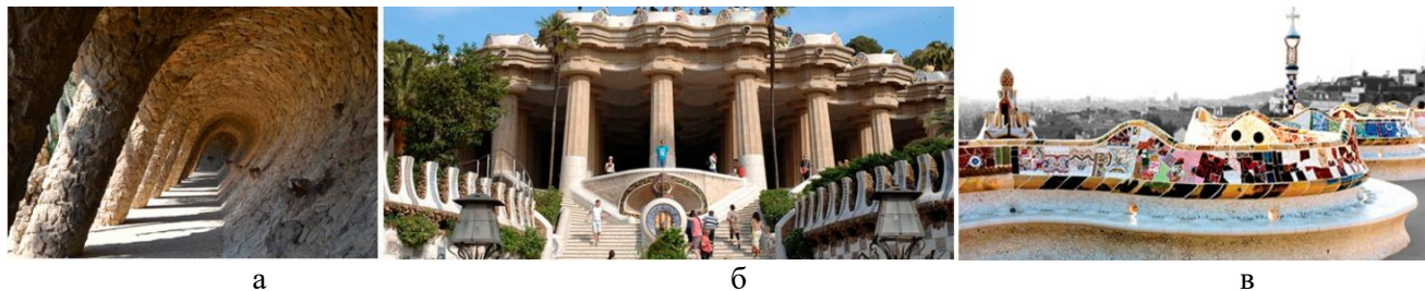
Рис. 5. Парк Гуэль, арх. Антонио Гауди, Барселона, 1900–1914 гг. [10]: а) портик в виде большой волны; б) лестница; в) волнистая скамья

Характерная для Гауди яркая фантазия проявляется в различных элементах. Лестничный пролет с его знаменитым драконом, покрытым цветными осколками битой керамики, ведет к гипостильному залу – впечатляющему пространству, состоящему из 86 колонн, которые лежат в основе площади наверху. Волнистая скамейка по периметру площади была спроектирована Жужодем, одним из соратников Гауди по строительству этого уникального парка, который был объявлен объектом Всемирного наследия [10].