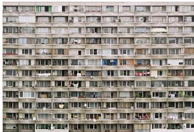
Рис. 2. Пример агрессивной среды [3]

Визуальная среда для городских жителей стала иной и в силу характера их труда. Люди работают в помещении, то есть в замкнутом пространстве: в цехах заводов и фабрик, в школах, институтах. В их интерьерах много новых материалов, отличных от природных: полированные стенки, пластик, линолеум, кафель, пленки, стекло, гофрированный алюминий, сетки, решетки, конструкции и т.п. Те же самые материалы формируют визуальную среду и в частных квартирах. Люди большое количество времени проводят в помещении, устают от урбанизации и больше тянутся к природе, как к чему-то естественному.