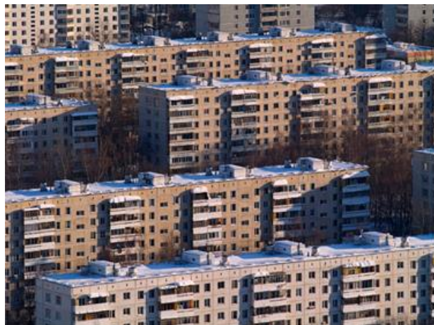
Рис. 1. Монотонная архитектура городов [2]

Особое негативное влияние на человека оказывают гомогенные и «агрессивные» поля. В первом случае это голые стены из бетона и стекла, глухие заборы, переходы и асфальтовое покрытие, а во втором – преобладание одинаковых монотонных элементов, например, ряды окон на плоских стенах высоких домов [1].