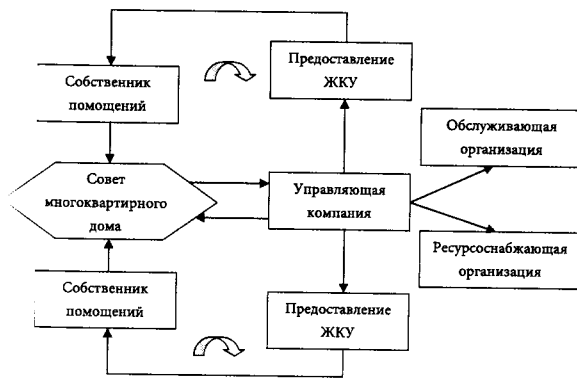
Рис. 1. Система взаимоотношений управляющей организации и собственников помещений в многоквартирном доме

ность его введения обусловлена стремлением вовлечь собственников помещений в процесс управления многоквартирным домом, повысить их активность и ответственность в вопросах содержания и эксплуатации общего имущества многоквартирного дома.