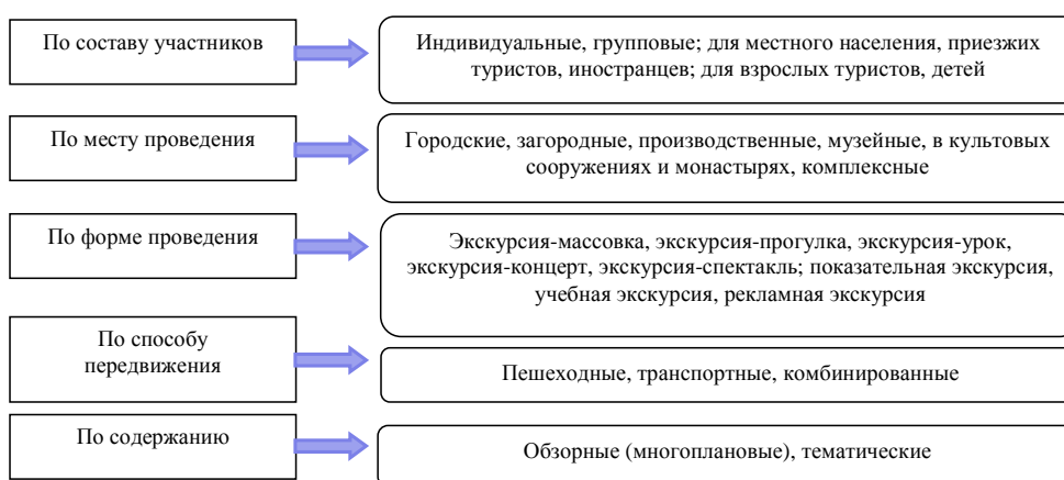
Рис. 1. Классификация экскурсий

Множество подходов к классификации экскурсий основываются на содержании, тематике, месте проведения, категории участников, форматах взаимодействия и других факторах. Согласно классификации выделяют обзорные и тематические маршруты. Экскурсии можно подразделить на: пешеходные, во время которых участники перемещаются пешком; экскурсии с использованием различных видов транспорта (автомобильного, водного, авиационного, железнодорожного, городского электрического, конного и др.); комбинированные, где используется и пешеходное передвижение, и транспортные средства. Данная классификация представлена в расширенном виде в трудах советского классика экскурсоведения Б. Емельянова (рис. 1).