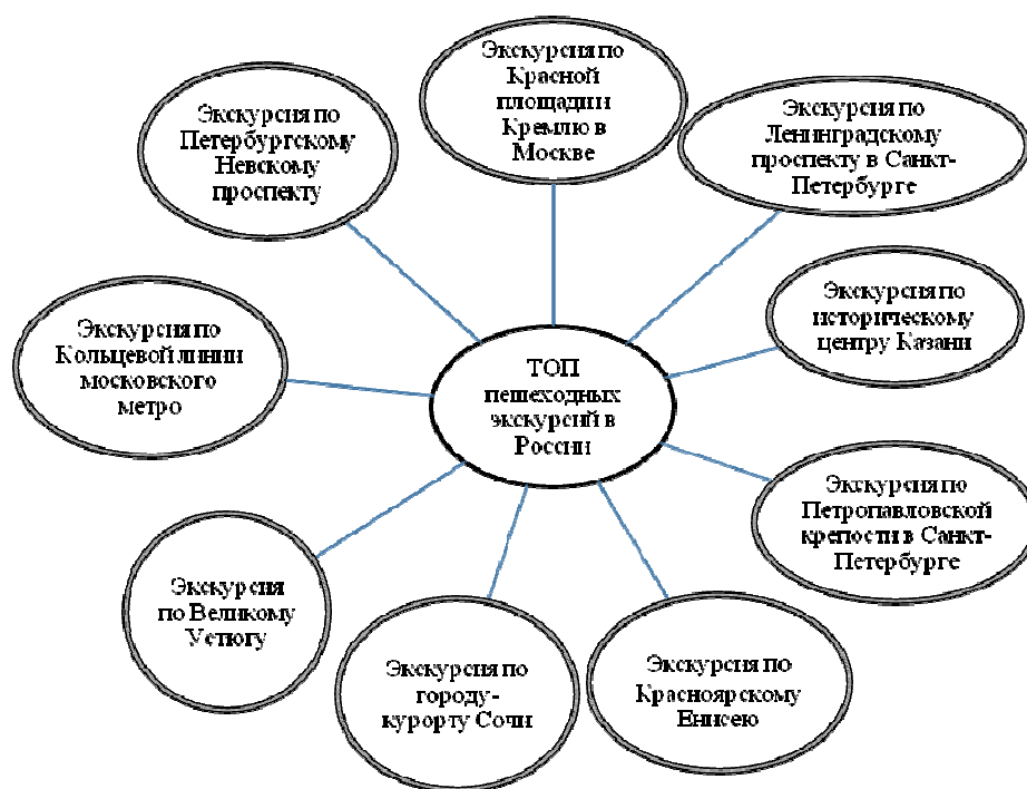
Рис. 2. Наиболее востребованные пешеходные экскурсии в России

Анализ отечественного опыта показал многообразие вариантов пешеходных экскурсий в разных городах, которое включает экскурсионные маршруты: обзорные и тематические. На рисунке 2 представлены самые востребованные пешеходные экскурсии в России по данным портала Tripadvisor.