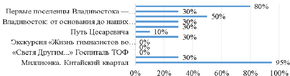
Рис. 4. Результаты анкетирования об известности пешеходных экскурсий гостям и жителям Владивостока

При анализе ответов респондентов о том, какие экскурсии на территории города им знакомы, мы получили результаты, представленные на рис. 4.