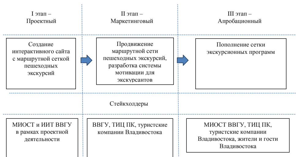
Рис. 5. Разработка комплекса мер по развитию маршрутной сети пешеходных экскурсий на территории Владивостока

В результате проведенного исследования нами был предложен полный комплекс мер по развитию маршрутной сети пешеходных экскурсий на территории Владивостока, представленный на рис. 5. Реализация запланированных мероприятий предусматривает вовлеченность Международного института окружающей среды и туризма (МИОСТ) Владивостокского государственного университета, а также туркомпании ООО «ВГУЭС ТРЭВЕЛ».