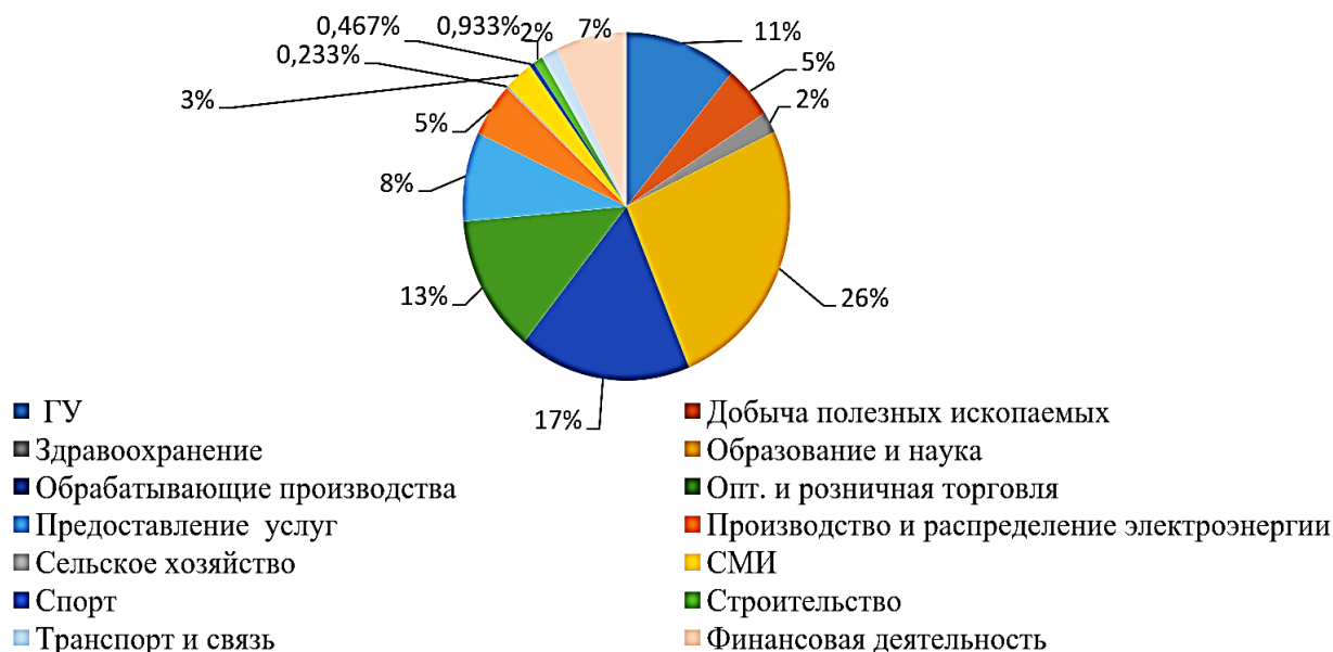
Рис. 1. Структура отраслей стратегических партнеров ведущих университетов

На рисунке 1 наглядно продемонстрирована структура партнеров по указанным отраслям.