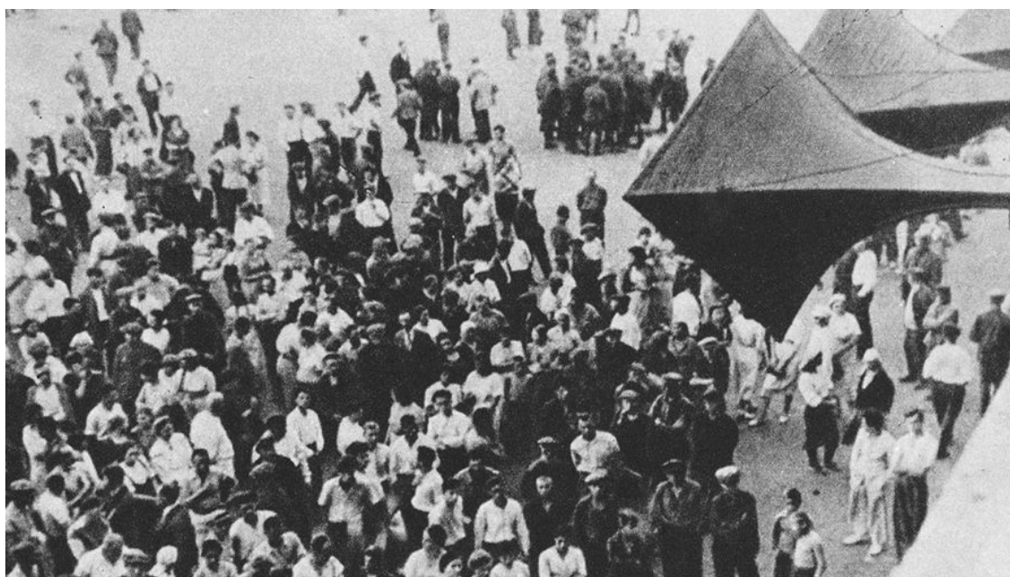
Рис. 3. Выходили на площадь, чтобы услышать речь Ю. Левитана

В июне 1941 года именно Левитан прочёл сообщение о начале войны и потом на протяжении всех четырех лет сообщал о ситуации на фронтах. Маршал Рокоссовский говорил, что голос Левитана был равносителен целой дивизии, а Гитлер считал его врагом рейха «номер один» [2].