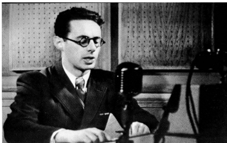
Рис. 2. Ю.Б. Левитан в радиорубке

Юрий родился 2 октября 1914 г. В детстве его прозвали «Трубой» – за зычный голос. Левитан мечтал стать артистом. Хотел быть известным и раздавать всем свои автографы. Пробовал даже поступать в кинотехникум, но увидел объявление о наборе в группу радиодикторов. На членов комиссии произвёл впечатление голос юного абитуриента – чёткий, от природы хорошо поставленный, завораживающий. Так Юрий Левитан был зачислен в группу стажёров Радиокomiteта. Юрий Борисович Левитан был очень строг к себе и, несмотря на отличные природные данные, много работал над голосом, избавляясь от владимирского «оканья». Наконец, ему поручили прочесть по радио статью из газеты "Правда". В ночь, когда стажёр Левитан впервые получил доступ к микрофону, у приёмника оказался Сталин. Услышав Левитана, он тут же набрал номер телефона тогдашнего председателя Радиокomiteта СССР и сказал, что текст его завтрашнего доклада должен прочесть диктор, который только что читал текст статьи [5].