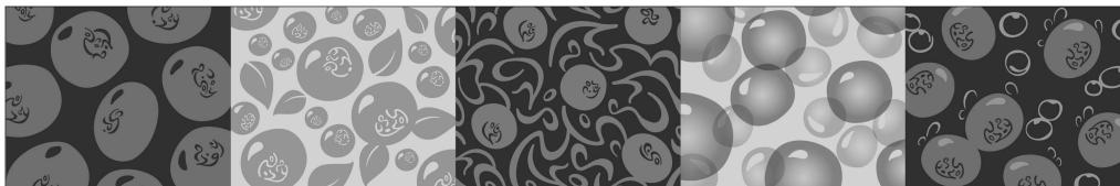
Рис. 3. Узоры из стилизованных зёрен сои

Стилизованные зёрна сои легли в основу второй подсистемы графических элементов. Причём на каждом зерне присутствует элемент, состоящий из перекомпонованных знаков логотипа (рис. 3). С этого и начинается проявление взаимодействия первой и второй подсистем.