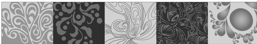
Рис. 4. Узоры из дополнительных элементов

Каждый узор имеет свою определённую область применения. В общей системе присутствует такое количество узоров, которое позволяет решить практически любую задачу по оформлению упаковки или носителя фирменного стиля. Взаимодействие подсистем узоров расширяет области применения системы визуальных элементов. Узоры раскрываются в фирменных цветовых гаммах по определённым законам. Цветовые гаммы подобраны таким образом, чтобы качественно решать любую задачу.