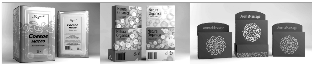
Рис. 5. Примеры оформления продукции

Декоративный принцип оформления упаковки и носителей фирменного стиля задаёт определённый вектор развития фирменного стиля предприятия «ЗАО УМЖК «Приморская соя». Принцип построения узоров и объединения их в подсистемы позволяет в будущем разработать новые подсистемы узоров, которые могут быть встроены в существующую систему. Таким образом, мы получаем фирменный стиль, способный к развитию и совершенствованию, не требующий кардинального рестайлинга (рис. 5).