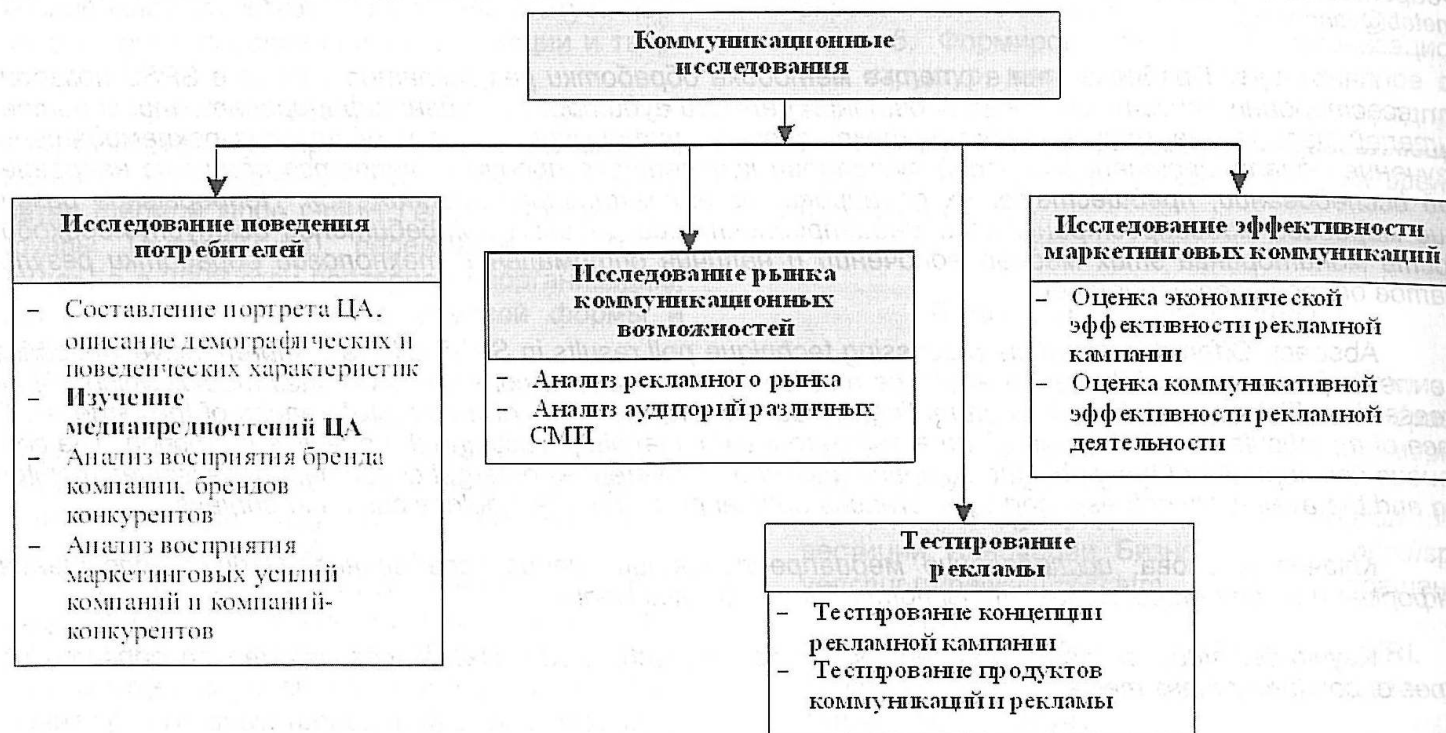
Рис. 1 Направления исследований в области информационного продвижения.

модатели, других - такие субъекты рекламного рынка как медиа каналы, подрядчики рекламного рынка, рекламные агентства и исследовательские компании.