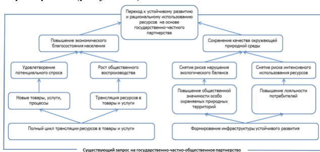
Рисунок 2 - Стратегическая карта управления факторами устойчивого развития и рационального использования ресурсов особо охраняемых природных территорий

Таким образом, к обсуждению в научном и профессиональном сообществе предлагается подход по управлению факторами устойчивого развития и рационального использования ресурсов особо охраняемых природных территорий с точки зрения возможности организации данного процесса на основе государственно-частного партнерства (рисунок 2).