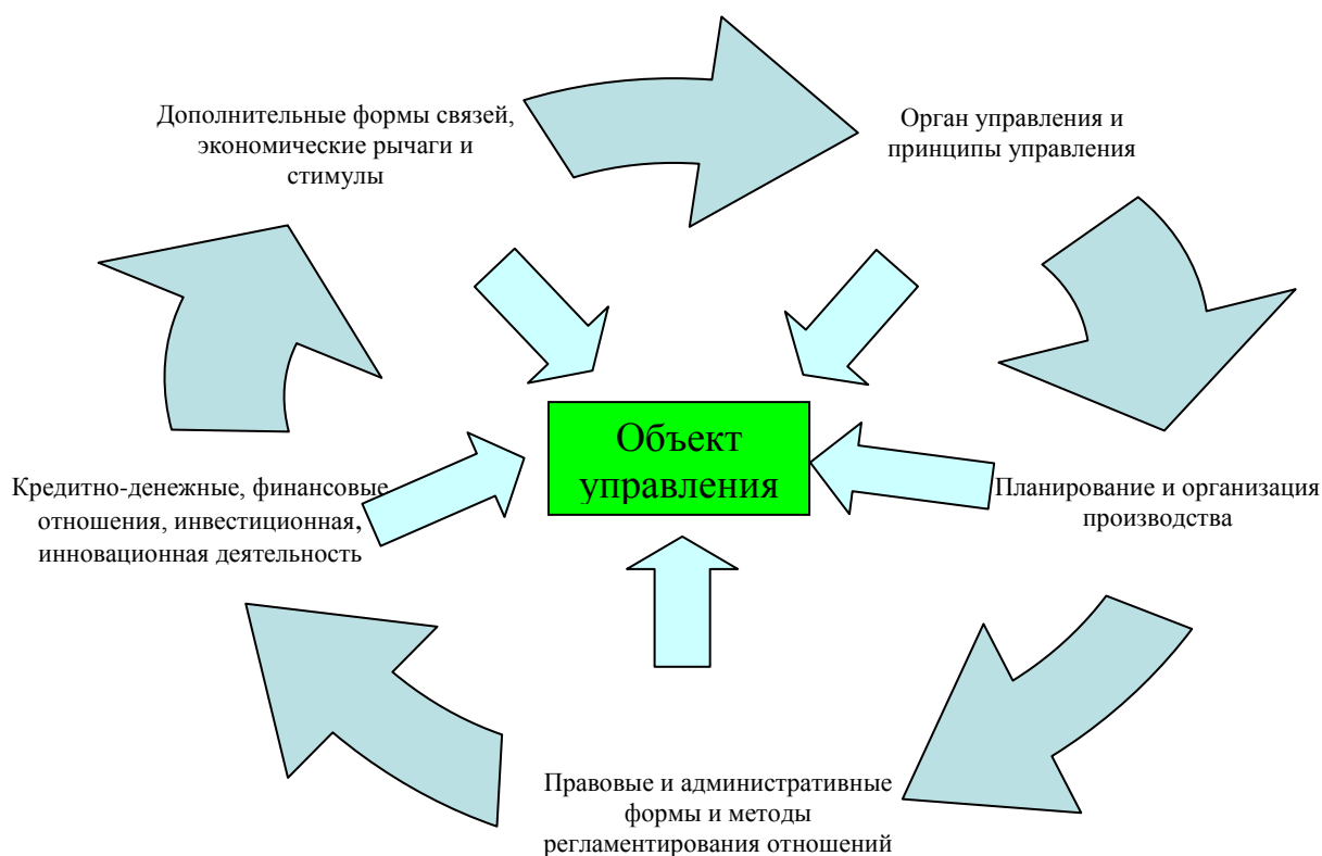
Рис. 1. Экономический механизм управления (Составлено автором).

Важно разработать принципы управления ПЭС. Одновременно это наполнит содержание планирования, организации туристско-рекреационной деятельности. В механизм управления должны быть введены дополнительные формы связей, экономические рычаги и стимулы производственных отношений.