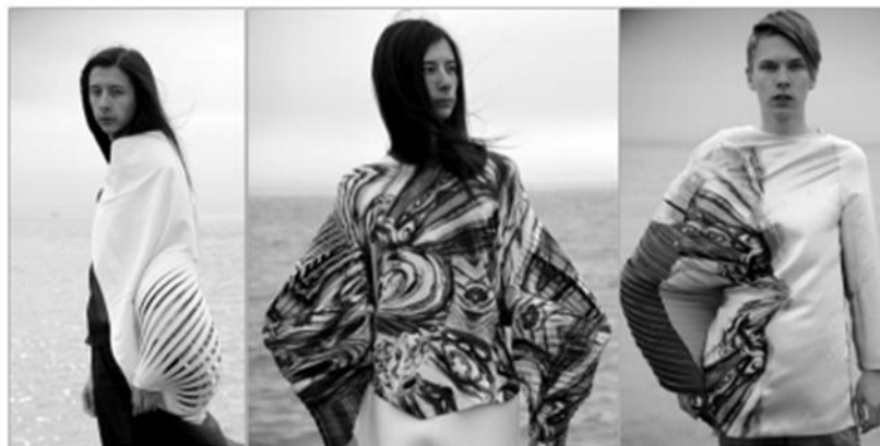
Рис. 5. Модели коллекции «Воды льдам»

При разработке моделей коллекции данная технология применялась в работе с различными материалами, такими как шелк, хлопковые и вискозные трикотажные полотна. С помощью введения в конструкцию изделий каркасных элементов из пластика была достигнута выразительная форма рукава комбинированного покроя. Полученная форма изделий выражает основную идею коллекции «Воды льдам» сочетанием жестких очертаний силуэта моделей с пластичностью и динамичностью конструкции в соответствии с рисунком 5.