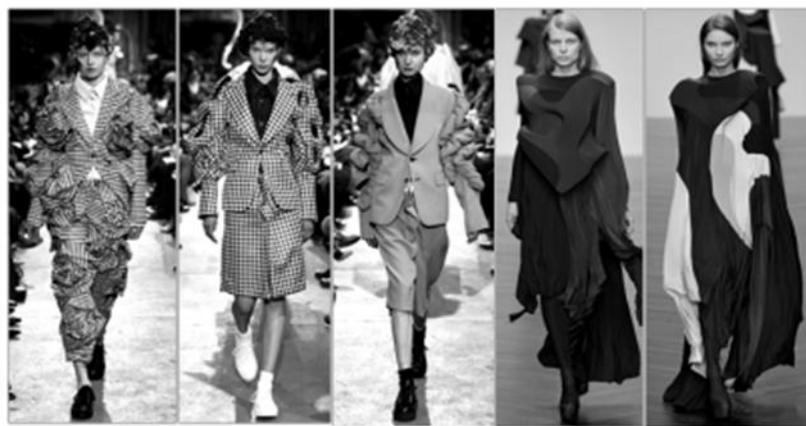
Рис.1. Конструктивные решения Comme de Garçons и St.Martins а/в 2013

При создании проекта коллекции было поставлено несколько задач. Во-первых – проанализировать существующие методы креативного формообразования и модные тенденции в данном направлении, выявить модели-аналоги и выяснить, насколько это возможно, какие из проектируемых решений инновационны, а какие уже были использованы ранее другими дизайнерами. В качестве моделей-аналогов были изучены как работы известных дизайнеров-авангардистов, таких как марка Comme de Garçons [2], так и коллекции молодых дизайнеров – выпускников колледжа St. Martins [3] и участников международных конкурсов дизайна одежды, для которых образность и инновационность моделей являются наиболее значимыми факторами. Анализ моделей-аналогов помогает в выборе наилучших пропорциональных решений в соответствии с рисунком 1.