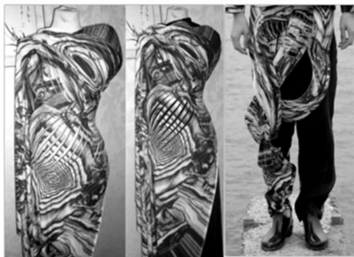
Рис. 4. Примеры использования авторской технологии при создании изделий