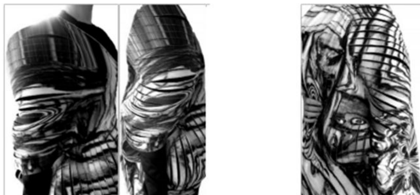
Рис. 3. Процесс поиска формы методом макетирования

В процессе создания изделия был проведен поиск вариантов формы. Некоторые из вариантов представлены на рисунках 3, 4.