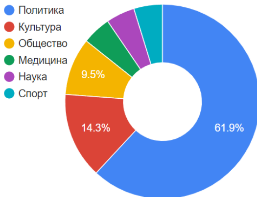
Рис. 2. Тематика статей с русскими паремиями вне контекста России