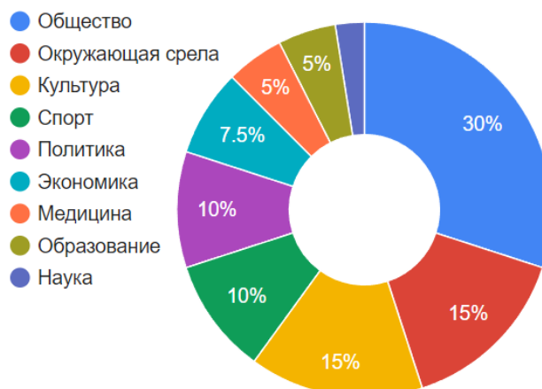
Рис. 4. Тематика статей с китайскими паремиями вне контекста Китая

В результате проведенного анализа было выявлено, что наиболее релевантными функциями китайских паремий в англоязычных СМИ являются моделирующая, регулятивная, метатекстовая и аттрактивная (табл. 2).