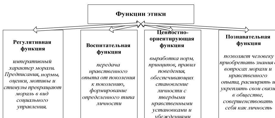
Рис. 1. Функции этики

Исходя из полинаучности феномена этики в науке выделяют функции этики (рис. 1).