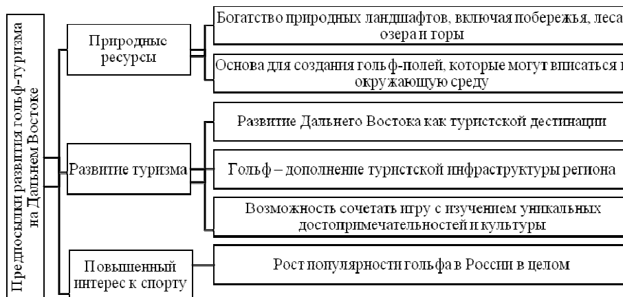
Рис. 2. Предпосылки развития гольф-туризма на Дальнем Востоке

Дальневосточный федеральный округ России представляет собой уникальную и привлекательную территорию для развития гольфа (рис. 2).