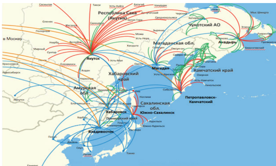
Рис. 3. Планируемая транспортная сеть компании «Аврора» к 2020 г.

Уникальные экологические объекты Камчатского края, где 29 действующих, 300 потухших и разрушенных вулканов. Шесть природных территорий, объединенных под общим названием «Вулканы Камчатки», включены ЮНЕСКО в список Всемирного культурного и природного наследия: Кроноцкий заповедник, Южно-Камчатский федеральный заказник, Быстринский, Налычевский, Ключевской и Южно-Камчатский природные парки. Четыре территории Камчатского края: Остров Карагинский, Мыс Утхоллок, Река Морошечная и Парапольский Дол – по решению российского правительства внесены в «Список находящихся на территории Российской Федерации водноболотных угодий, имеющих международное значение, главным образом в качестве местообитаний водоплавающих птиц».