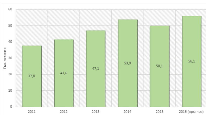
Рис. 4. Динамика авиапассажиропотока через аэропорт Владивостока в Петропавловск-Камчатский (тыс. чел.)

Перечисленные конкурентные преимущества могут и должны быть усилены в предстоящие годы. С целью определения приоритетных направлений этой работы автором настоящей статьи было проведено интервьюирование целого ряда своих коллег из научно-образовательной среды КНР, Республики Корея, Вьетнама и Японии, что позволяет сделать следующие выводы.