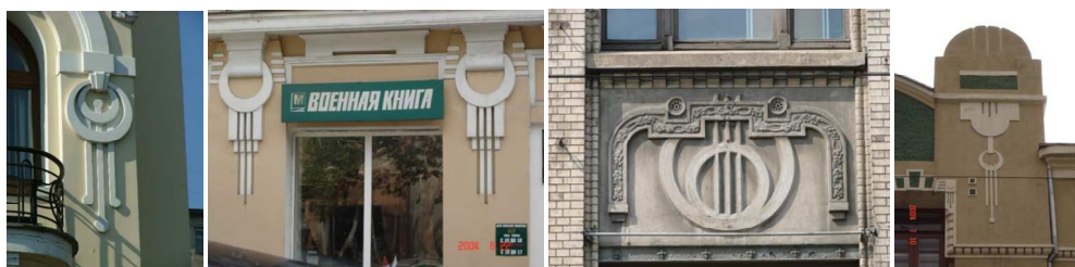
Рис. 1. Характерная деталь венского сецессиона «кольцо в кольце» и спускающиеся ленты

Архитектурная деталь, широко повторяющаяся на значительном количестве зданий в различных вариациях, становится узнаваемым элементом, формируя характерный архитектурный образ города. Появившаяся впервые в Вене на жилом здании Отто Вагнера на Линке-Винцайле деталь «кольцо в кольце» устойчиво внедрилась в архитектуру Владивостока и стала в различных вариациях характерной деталью венского сецессиона на зданиях города (рис. 1). Отто Вагнер использовал неглубокие параллельные каннелюры для вертикального членения плоскостей стен и пилястров. Вагнеровские каннелюры всегда обрываются, не доходя до земли; их нижние концы обычно образуют обращённый вниз треугольник. В соединении с окружностями, столь любимыми мастерами сецессиона, деталь напоминает стилизованный венок или серьгу и широко используется многими мастерами венского и немецкого модерна. Именно в венском модерне мы наблюдаем упрощение и герметизацию архитектурного языка, получившие распространение во Владивостоке.