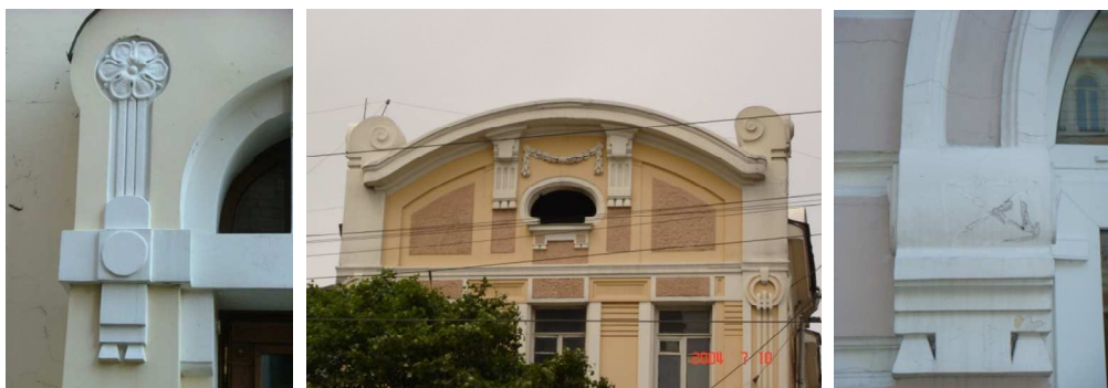
Рис. 2. Гутты в архитектурной детали Владивостока