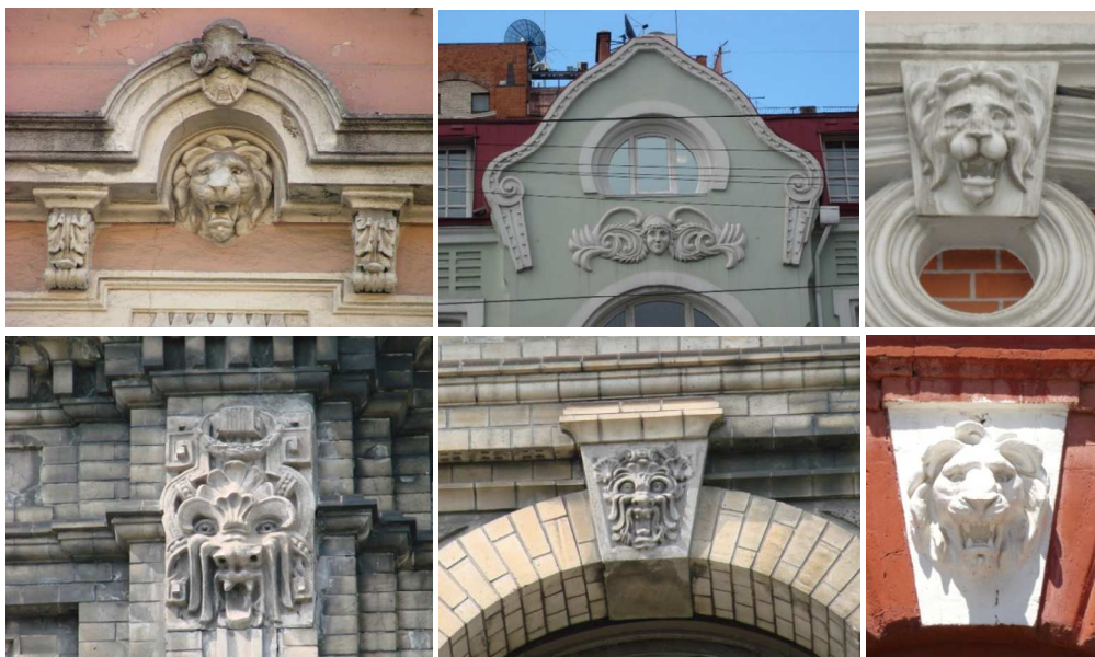
Рис. 4. Маскароны на зданиях Владивостока