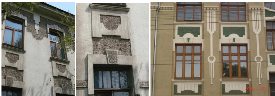
Рис. 5. Характерное использование гладкой и грубой штукатурки