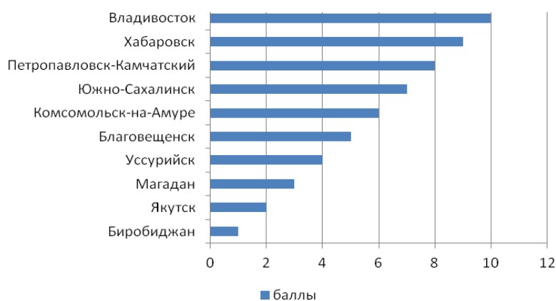
Рис. 2. Топ-10 популярных у туристов городов Дальнего Востока в 2018 г. (составлено по данным Турстата)

Исходя из представленных данных Приморский край является ключевой точкой межрегиональных туров ДФО. 29 из 30 проанализированных маршрутов (96%) проходят через территорию Приморского края, что позиционирует его, прежде всего, как транзитную территорию. Следующим по популярности посещения является Камчатский край, на одну позицию от него отстает Хабаровский край. Через регионы проходит 14 и 13 маршрутов: 47% (Камчатский край) и 43% (Хабаровский край). Ниже по значению показателей представлена Сахалинская область, на ее территории проходят 8 маршрутов, или 27%. Через Республику Саха (Якутия) проходит 7 маршрутов (23%). Наименьшее число маршрутов в Магаданской области, её рейтинг составляет около 10% (3 маршрута).