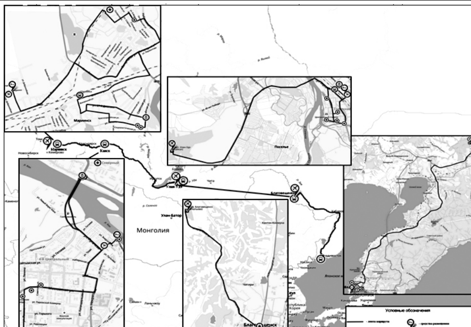
Рис. 4. Карта-схема маршрута «Арки цесаревича: восточное путешествие Николая II»

Выводы и научная новизна. В ходе исследования выявлено, что трансграничность является ключевым фактором развития Дальнего Востока России, сфера туризма при этом имеет следующие особенности. Во-первых, близость стран АТР, что определяет доступность ДФО для жителей данных территорий. Во-вторых, широкие возможности для расширения внешнеэкономических связей и организации международных проектов и маршрутов. В-третьих, наличие необходимых ресурсов дает возможность развивать Дальневосточный федеральный округ в рамках трансграничных туров под брендом «Восточное кольцо России». Более того, при системном продвижении бренда можно существенно увеличить популярность региона в целом.