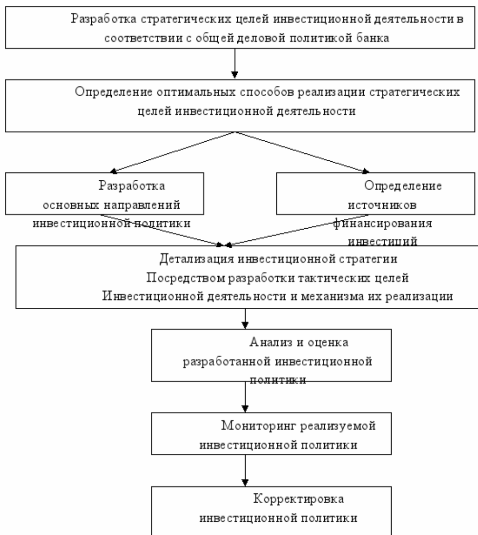
Рис.2 – Процесс формирования инвестиционной политики банка в наиболее общем виде

8. получение дополнительного эффекта при приобретении акций финансовых институтов, покупке филиалов, учреждение дочерних финансовых институтов в результате увеличения капитала и активов, соответствующего расширения масштабов операций, мобильного перераспределения имеющихся ресурсов, диверсификации средств, выхода на новые рынки, экономии текущих затрат.