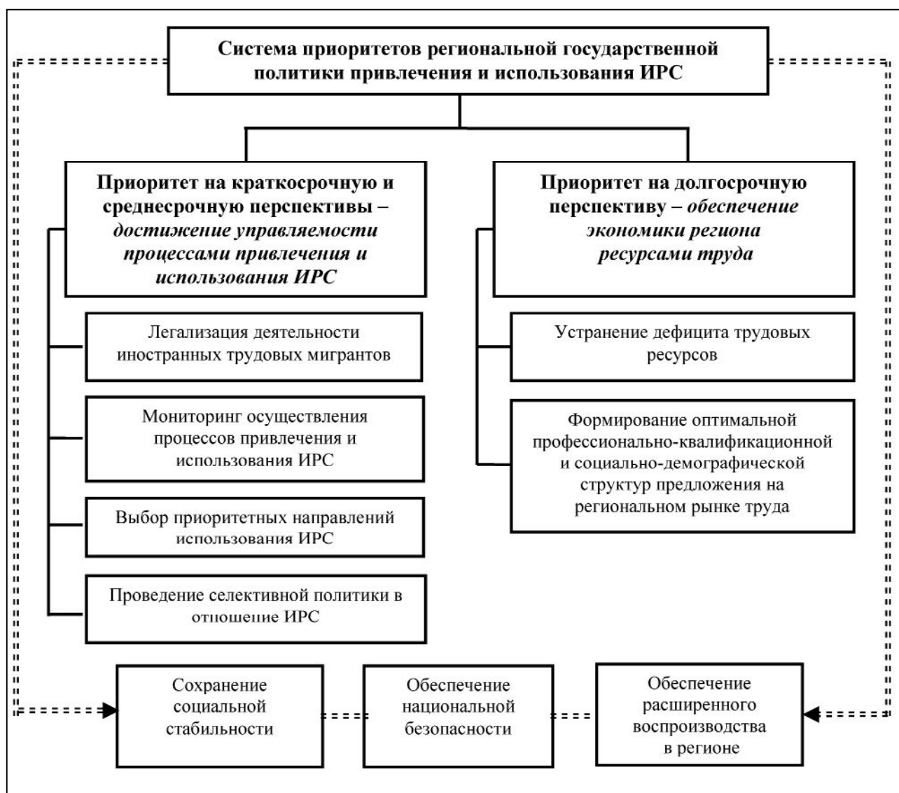
Рис. 1. Система приоритетов региональной государственной политики привлечения и использования ИРС

2) каково оптимальное соотношение в использовании различных источников рабочей силы для обеспечения экономики региона ресурсами труда;